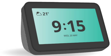
Một số loa thông minh có màn hình màu hiển thị thông tin